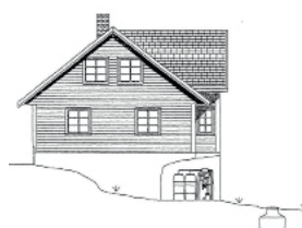
FD 5 Std. Nedgravd mottakstank i hagen