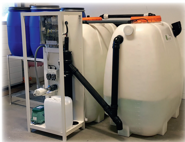
BIOVAC® FD5 MG