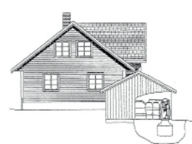
FD 5 Std. Nedgravd mottakstank under garasje/anneks