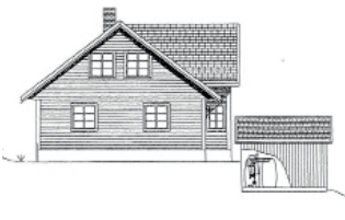
FD 5 MG, Mottakstank på gulv i garasje/anneks